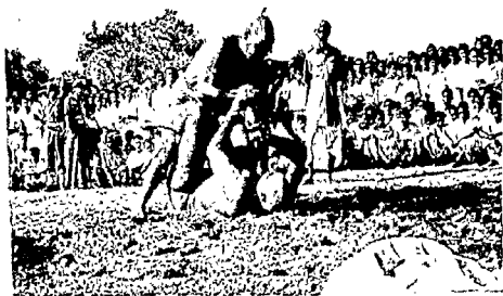
Fig. 4 Vajramsti Wrestling : Middle stage